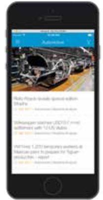
AutoIntelligence日报移动应用程序