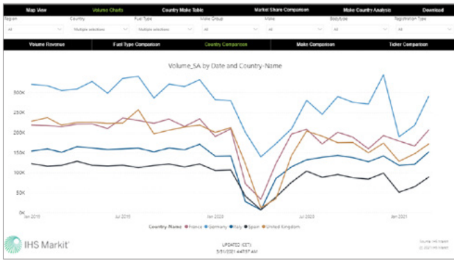
台数チャート | 国別比較