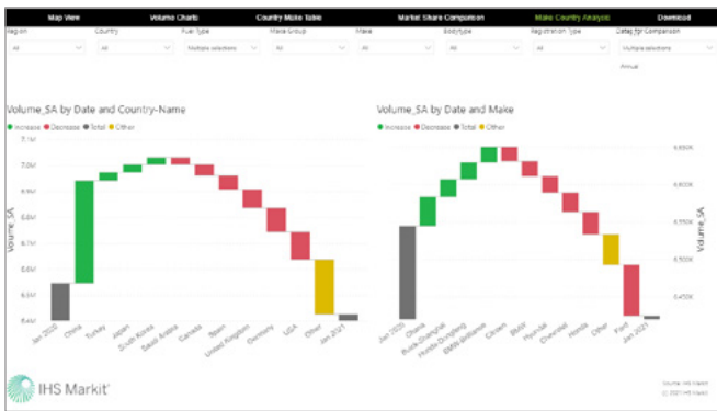
国別ブランド別比較 (ウォーターフォールチャート)