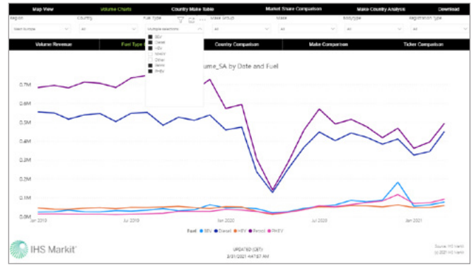
台数チャート | 燃料タイプ別比較